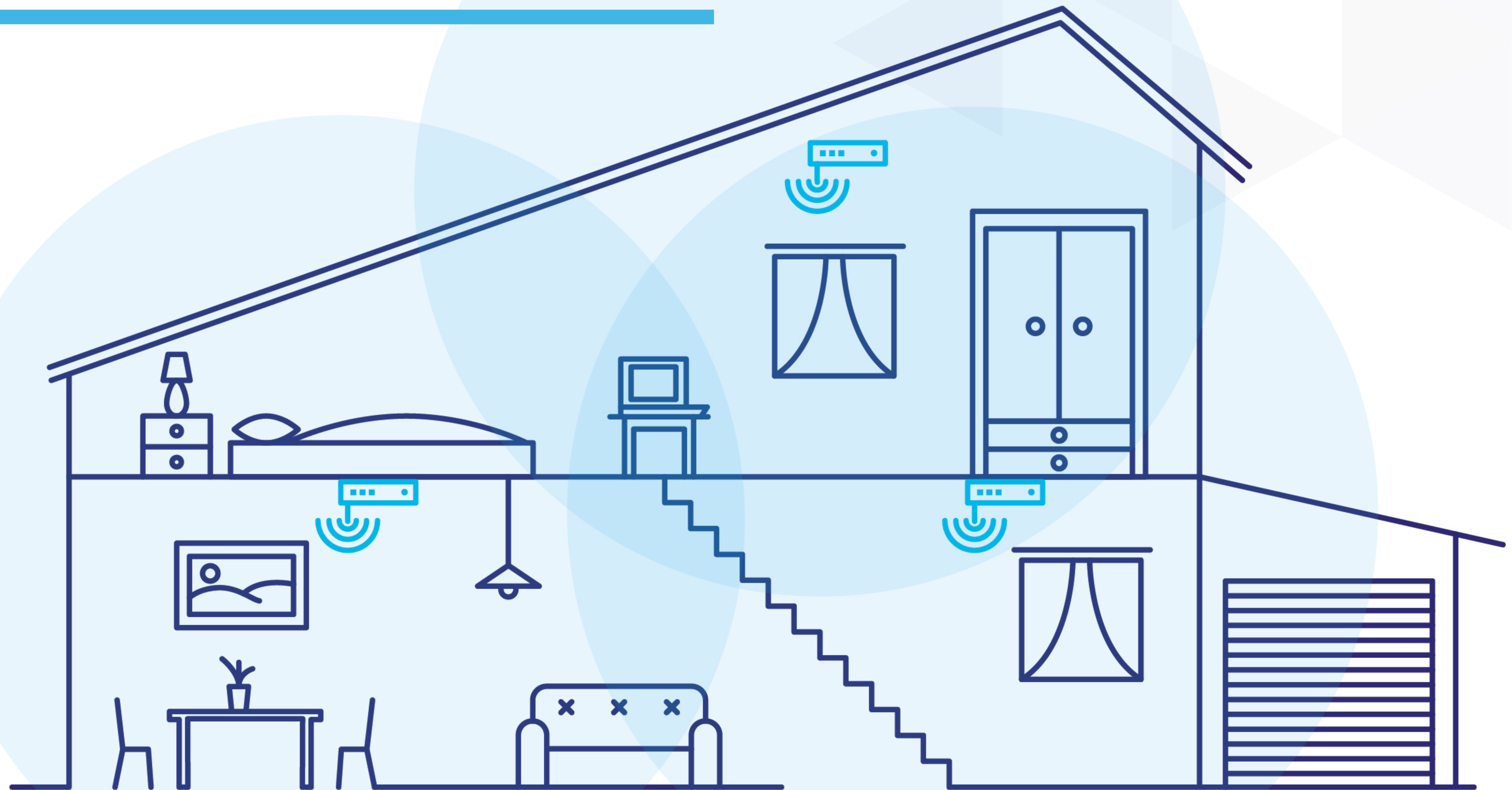
Obrázek: Wi-Fi mesh technologie